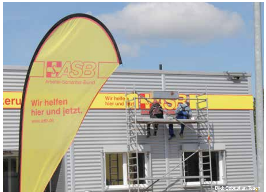
Der letzte Schliff: Pünktlich zur Eröffnung war das Bildungszentrum in Güstrow weithin sichtbar.

Bereits im Mai wurde das Bildungszentrum feierlich eröffnet. Landesvorstand, Geschäftsführer:innen aller Gliederungen im Bundesland sowie Mitarbeiter:innen und Leiter:innen der bestehenden Einrichtungen waren eingeladen, sich einen Eindruck zu verschaffen.