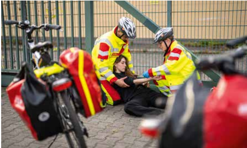
Im Notfall sind die Rettungskräfte des ASB auch per Fahrradstaffel zuverlässig und klimafreundlich unterwegs zur Einsatzstelle.

» zeigen, dass Nachhaltigkeit und Klimaneutralität Themen sind, die auch in den Wohlfahrtsverbänden eine Rolle spielen.